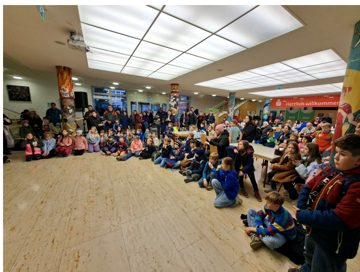
Warten auf die Siegerehrung

https://s1.chess- results.com/tnr1300132.aspx?lan=0&art =0&turdet=YES&SNode=S0 -----