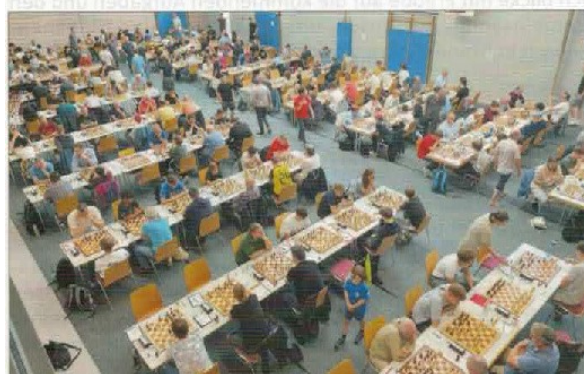
Blick auf den Turniersaal

Für 5 Tage belegten 267 Schachspieler im Rahmen des 7. Bamberger Schachopens das Klemens-Fink-Zentrum für Gehörlose komplett mit Beschlag und wurden von der gastronomischen Mannschaft der Gehörlosen bestens versorgt. Entsprechend der Durchführung auch als 7. Internationale Fränkische